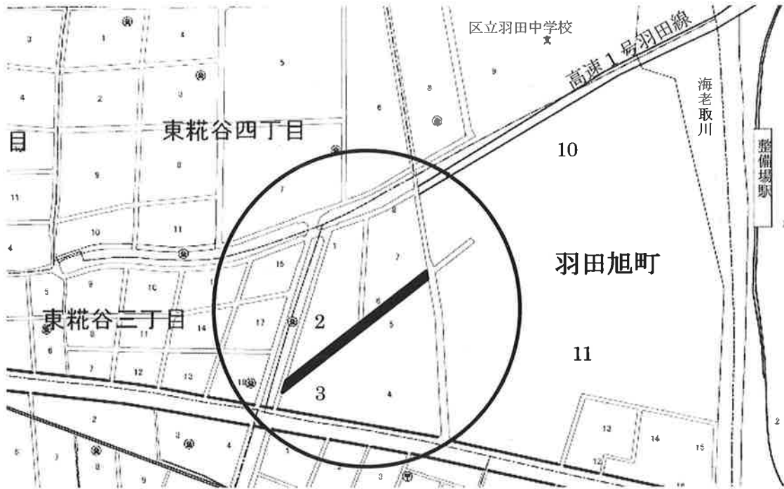
特別区道路線の認定略図

所在 羽田旭町3番1の地先から同2番53の地先まで (住居表示 羽田旭町5番から同2番まで)